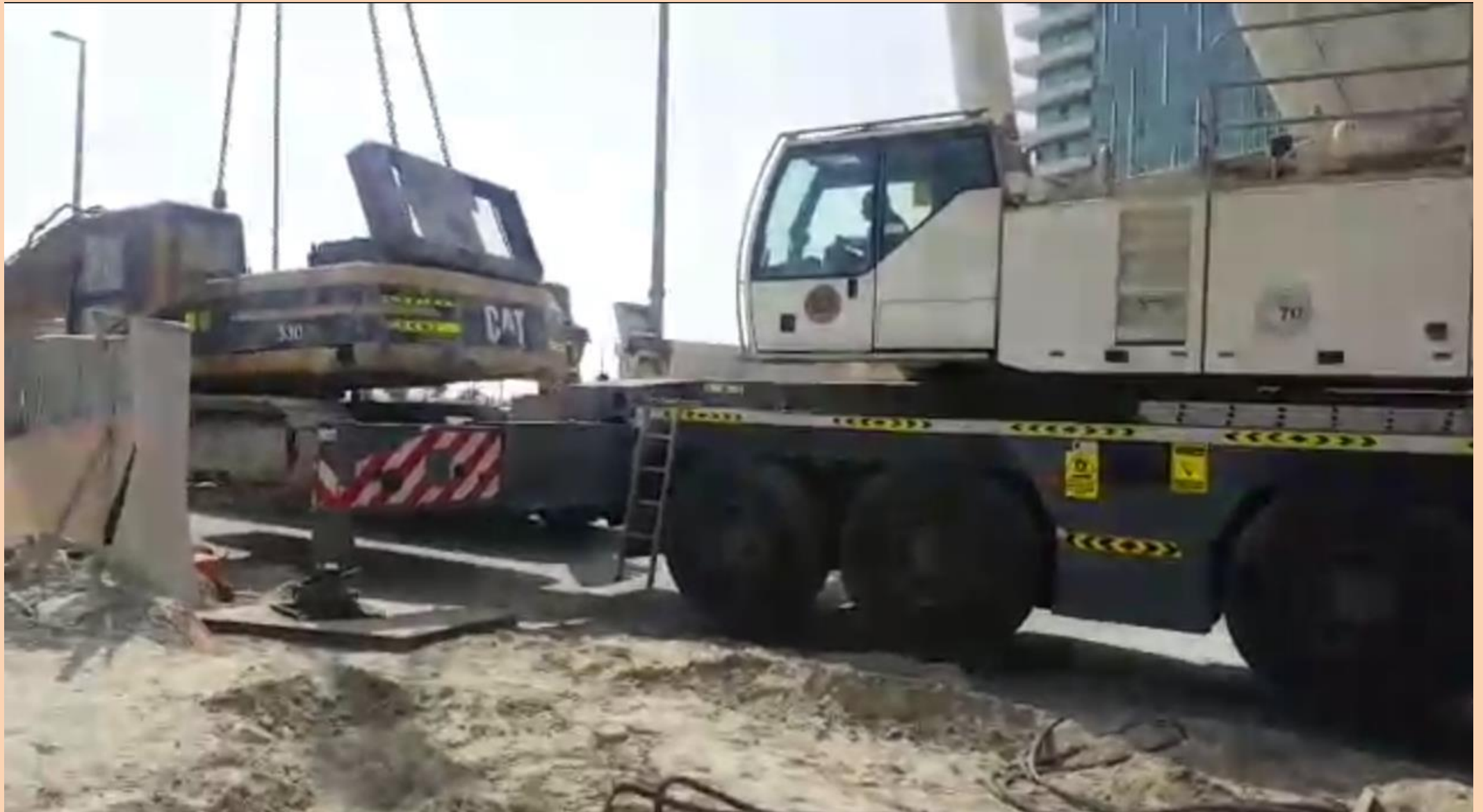
END OF SHIFTING EXCAVATOR FROM WORK SITE BY M/s THE WHITE DUNE TRANSPORT & GENERAL CONTRACTING