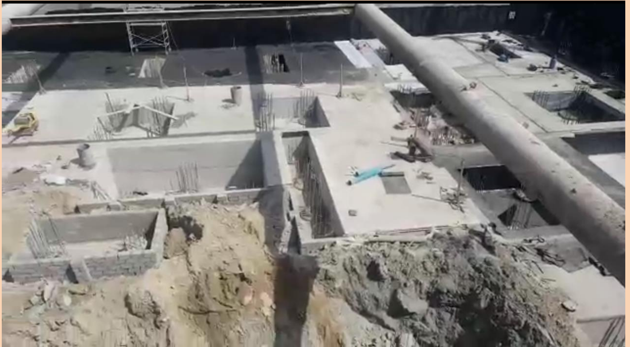
END OF EXCAVATION PROJECT BY M/s THE WHITE DUNE TRANSPORT & GENERAL CONTRACTING